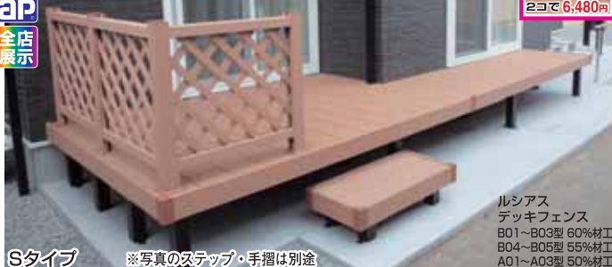
Sタイプ ※写真のステップ・手摺は別途

ルシアス デッキフェンス B01~B03型 60%材工 B04~B05型 55%材工 A01~A03型 50%材工