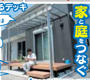
↑独立式 リウッドステップ2型

※束柱安定・湿気防止 雑草防止・床の変型防止 階段昇り降り安全のため デッキ下・階段部 土間コンクリート打を 特におすすめします (別途見積)